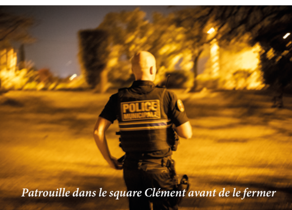
Patrouille dans le square Clément avant de le fermer