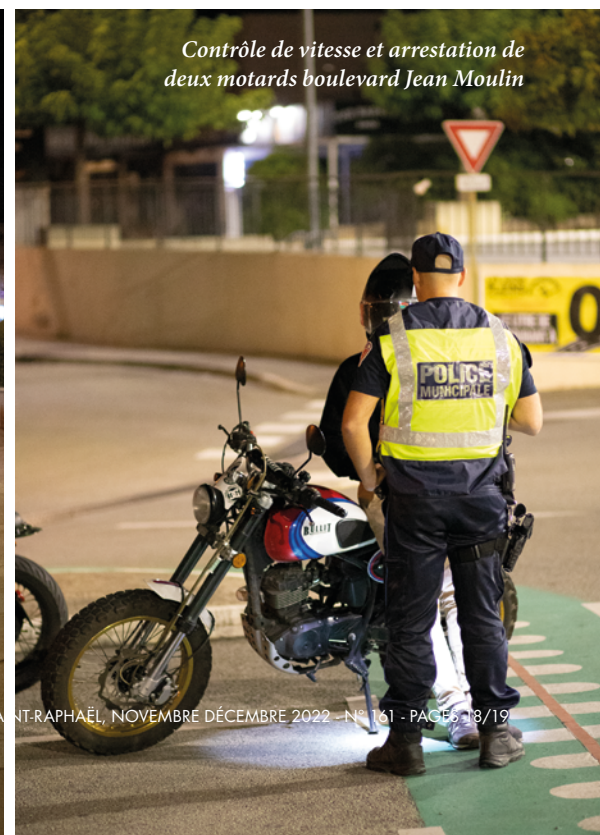
Contrôle de vitesse et arrestation de deux motards boulevard Jean Moulin