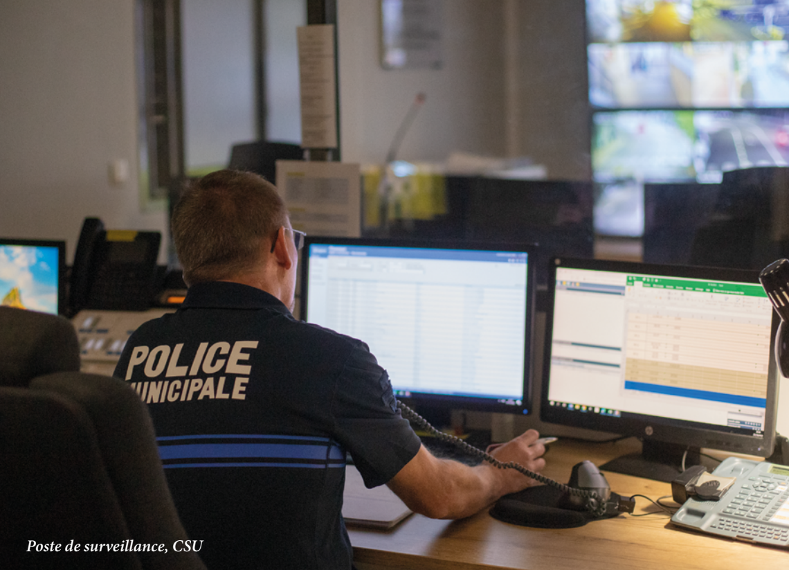
Poste de surveillance, CSU