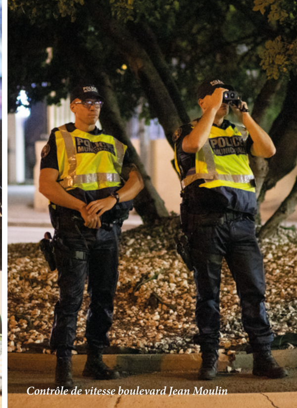
Contrôle de vitesse boulevard Jean Moulin