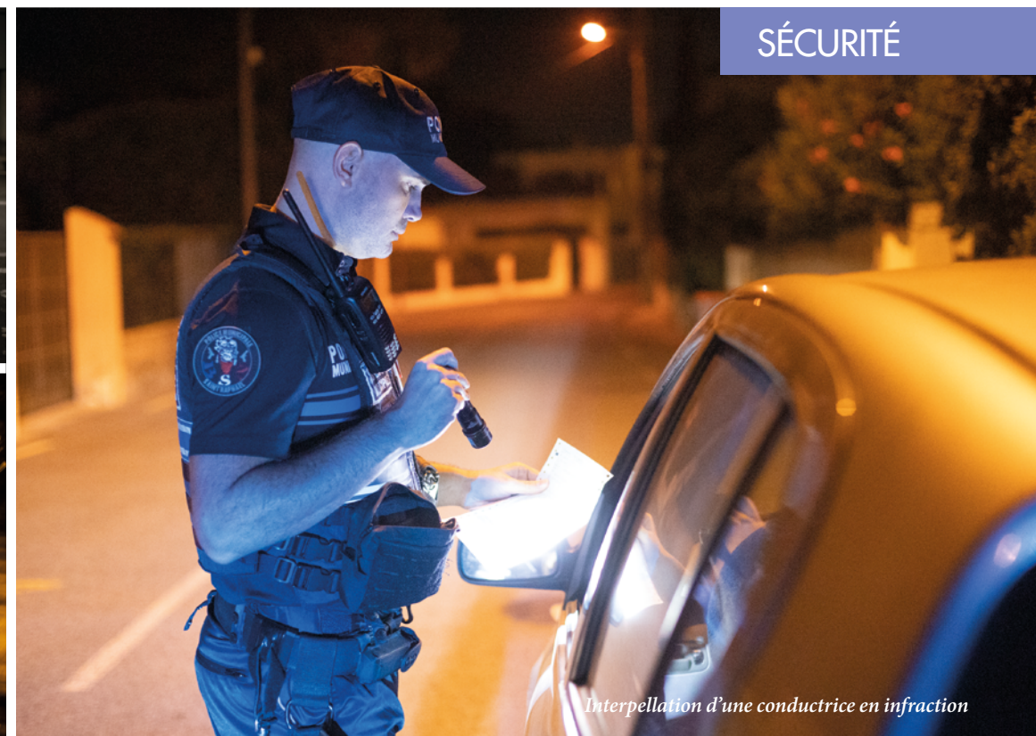
Interpellation d'une conductrice en infraction