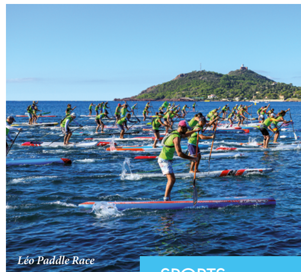
Léo Paddle Race

En 2023, le Tour des Alpes-Maritimes et du Var, l'Estérel Futnet Cup, un tournoi 3vs3 de basket et le mondial amateur de rugby, notamment, devraient être au programme.