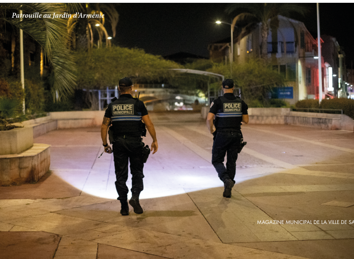
Patrouille au Jardin d'Arménie