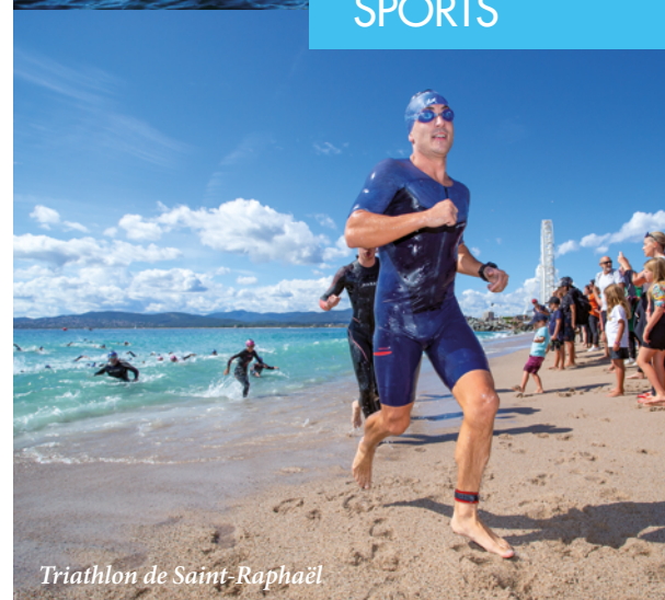
Triathlon de Saint-Raphaël