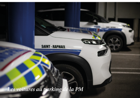
Les voitures au parking de la PM